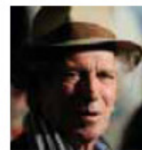
Keith Richards.

om har varit "en kaleidoskopisk erfarenhet". "Att tala med personer som var med och få deras version av händelser och sedan försöka få ihop allt var väldigt intressant", säger han till Independents reporter. (TT Spektra)